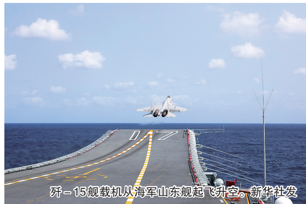
歼-15舰载机从海军山东舰起飞升空。

新华社南京4月10日电 中国人民解放军东部战区于4月8日至10日圆满完成环台岛战备警巡和“联合利剑”演习各项任务,全面检验了实战条件下部队多军兵种一体化联合作战能力。