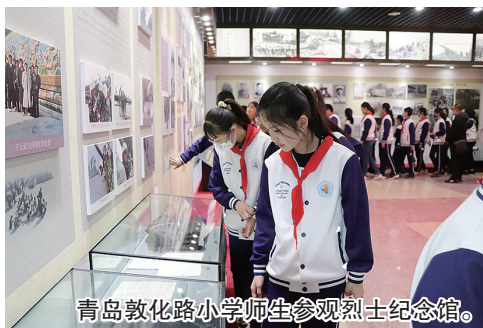
青岛敦化路小学师生参观烈士纪念馆。

为致敬英雄，缅怀先烈，青岛敦化路小学开展了“缅怀革命先烈 传承红色基因”祭扫革命烈士纪念碑活动。