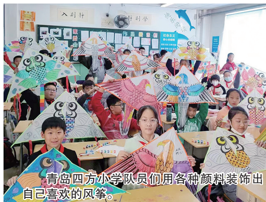
青岛四方小学队员们用各种颜料装饰出自己喜欢的风筝。

青岛四方小学近日开展了清明节系列活动。课堂上，辅导员讲解了清明节的由来和传统习俗，队员们讲述英烈故事；学校组织党员教师和六年级少先队员到崂山革命烈士陵园，举行“缅怀先烈 放飞理想”为主题的扫墓活动；在“彩绘风筝，放飞理想”活动中，队员们用各种颜料装饰出自己喜欢的风筝；少先队员积极参加网上祭英烈活动，表达对革命先烈的深切缅怀之情。