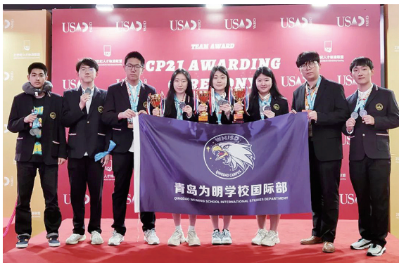
青岛为明学校国际部斩获 USAD 美国学术十项全能竞赛全国金牌。

3月24日至3月26日，2023USAD美国学术十项全能竞赛——主题：“破局之路 The Age of Transformation”在海南省海口市举行！来自全国各地国际学校百余支队伍齐聚海南省海口市，共赴这项极具含金量的学术赛事。