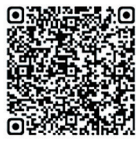
青岛营商环境问卷

人人都是营商环境，个个都是开放形象！让我们行动起来，一起为青岛优化营商环境贡献智慧和力量！衷心感谢您的信任和支持！