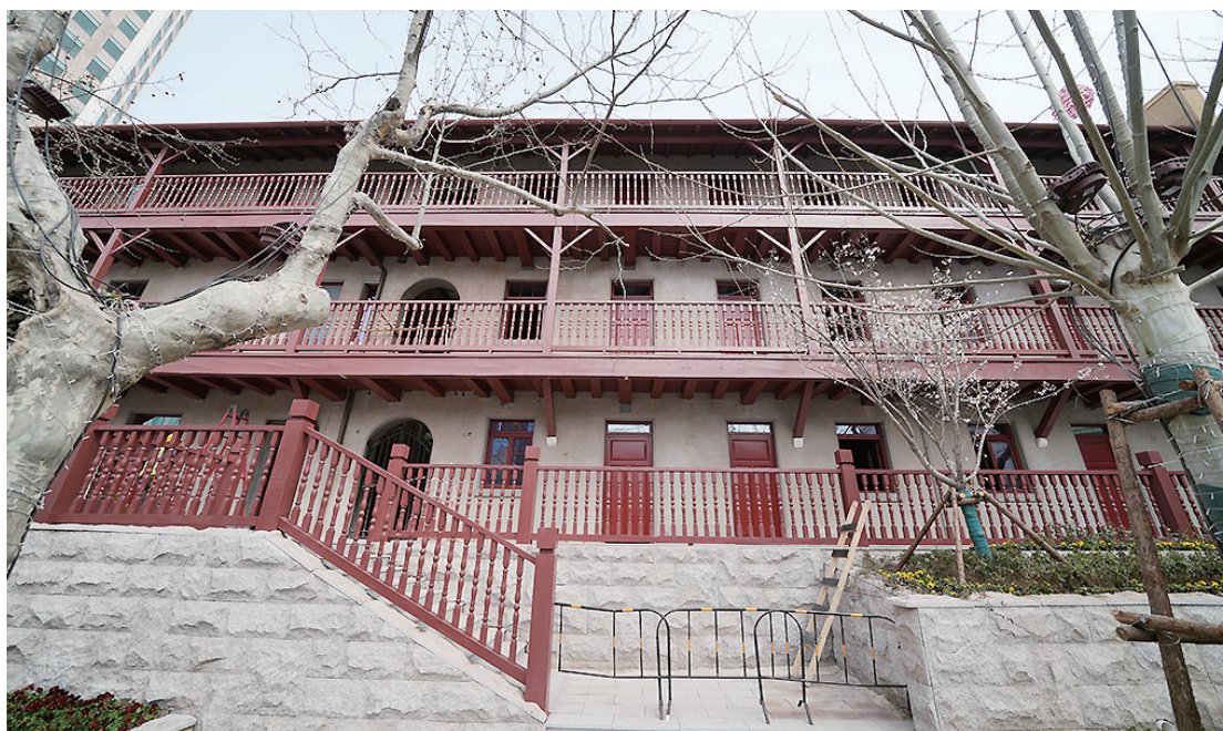
即墨路24号即将华丽蜕变。

雪白的花瓣映衬着暗红的栏杆,有着90多年历史的即墨路24号院,正在重新焕发生机。这栋楼院是地铁集团让老建筑借助地铁提档升级的一个缩影。4月3日,记者从地铁集团获悉,紧抓城市更新和城市建设三年攻坚行动的契机,在建设“轨道上的城市”征程中努力承担起时代和城市赋予的重要使命,遵循“保护中发展,发展中保护”的整体思路,以地铁站点周边房屋改造为切入口,恢复沿线历史街区风貌,重拾城市记忆,激活文化基底,促进产业升级,推动历史城区可持续、高质量发展。四方路历史文化街区两座里院即将迎来华丽蝶变。