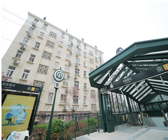
沧安路6号老楼变公寓,紧邻地铁口。

“建筑是凝固的历史,不仅见证着岁月变迁的时光,还印证着时代发展的脚步。”青铁商业相关负责人告诉记者,过程中他们以“文