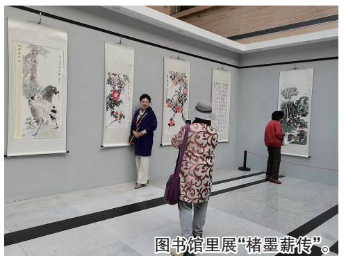
图书馆里展“楮墨薪传”。

人间四月芳菲始,又是一年清明时。青岛市图书馆将通过线上和线下渠道,推出社会实践、国学吟诵、主题展览、线上竞答等清明主题公益文化活动,让广大读者在阅读中缅怀革命先烈、弘扬中华优秀传统文化。