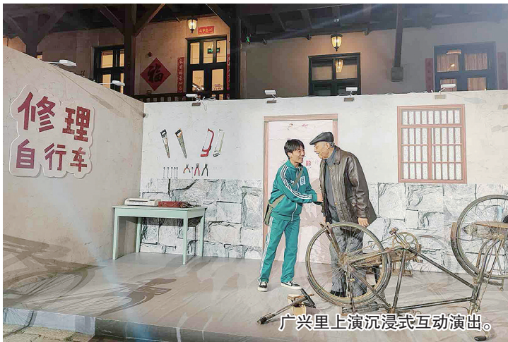
广兴里上演沉浸式互动演出。