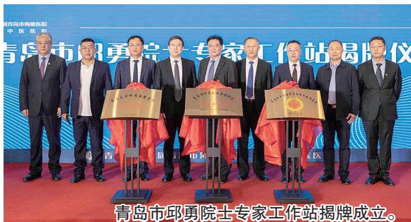
青岛市邱勇院士专家工作站揭牌成立。

医院脊柱矫形中心成立后，邱勇院士专家团队将每月定期来青坐诊、手术，将目前国际上最先进的脊柱矫形诊疗技术和手术服务带到岛城，让百姓在家门口就能享受到国际高水平、高精尖医疗服务。