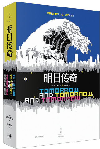
[美]加·泽文 著 张亦琦 译 上海人民出版社 2023年2月出版

泽文说这是一本关于爱、艺术、电子游戏和时间的书，是一个关于野心勃勃的年轻艺术家的故事，以及他们的作品、创造作品的动因，如何随时间的推移而变化。《明日传奇》也是迄今与泽文本人的生命经验贴得最近的一部小说，能看到不少她个人关于社会问题、成长困扰、女性境遇的表达。她和书里的主人公们一样热爱游戏，对生活充满热忱，在东海岸的马萨诸塞州读了大学后又回到了西海岸的洛杉矶生活，而且她的父母也都是计算机行业的从业者。不仅如此，她也和主人公萨姆一样，有一半的亚裔血统，而莎蒂作为女性创作者的困境和疑虑又何尝不是加·泽文自己的遭遇。