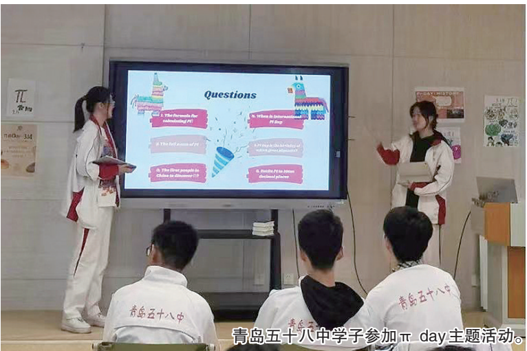
青岛五十八中学子参加π day主题活动。