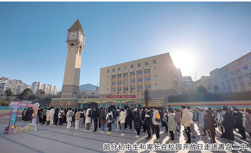
部分初中生和家长在校园开放日走进青岛二中。