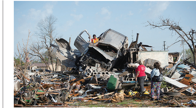
3月25日,在美国密西西比州罗灵福克镇,当地居民在残骸中搜寻可用物品。

美国南部密西西比州和亚拉巴马州多地24日晚遭罕见龙卷风肆虐,大量建筑被夷为平地,部分小镇几乎“被从地图上抹除”。截至25日的官方数据显示,龙卷风在两州造成的死亡人数升至26人。 据美国国家气象局设于密西西比州首府杰克逊市的办公室介绍,这一机构24日晚至25日晨接到风暴雨追逐者和目击者至少24次龙卷风报告。根据这些报告和雷达数据的初步测算显示,龙卷风在地面