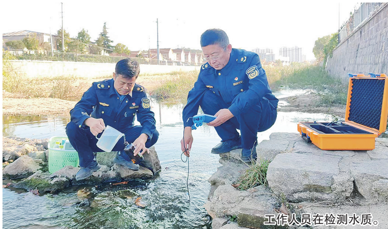
工作人员在检测水质。

加强农村生活污水治理是全面推进乡村振兴,建设农业强国的必备前提和重要基础。近年来,崂山区累计投资11.75亿元,完成99个农村社区的生活污水治理任务,在全市率先实现省厅提出的农村生活污水“整县制全域治理”目标,为改善农村水生态环境提供了坚强保障。今年以来,崂山区及时调整工作重心,将治理优先转为治理与运维并重,力争在污水处理设施运维管理方面找创新、做文章,进一步巩固提升治理工作成效。