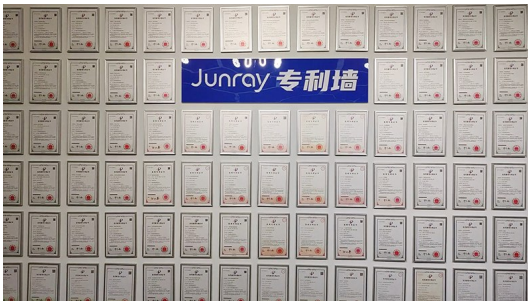
青岛众瑞智能仪器股份有限公司的专利墙。

“经过三年的运营发展,园区已经建立了一个完整的生物科技产业链条,园区内百余家长生物医药类企业覆盖了产业链的上中下游,其中既有全国最早拿到