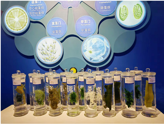
青岛明月海藻集团博物馆内的海藻粘片。

2015年,黄海冷水团养殖三文鱼项目正式启动,通过在深海放置分布式网箱养殖三文鱼,由中央综合管理平台统一管理,即便是在陆地上,也能实时监控网箱中三文鱼的生长情况。