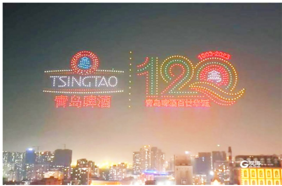
无人机打造光影画卷。

本报3月21日讯 21日,“感恩百廿同行 共创美好未来”青岛啤酒120周年华诞纪念标识发布暨系列主题活动启动仪式在青岛啤酒发源地青岛啤酒厂举行,隆重