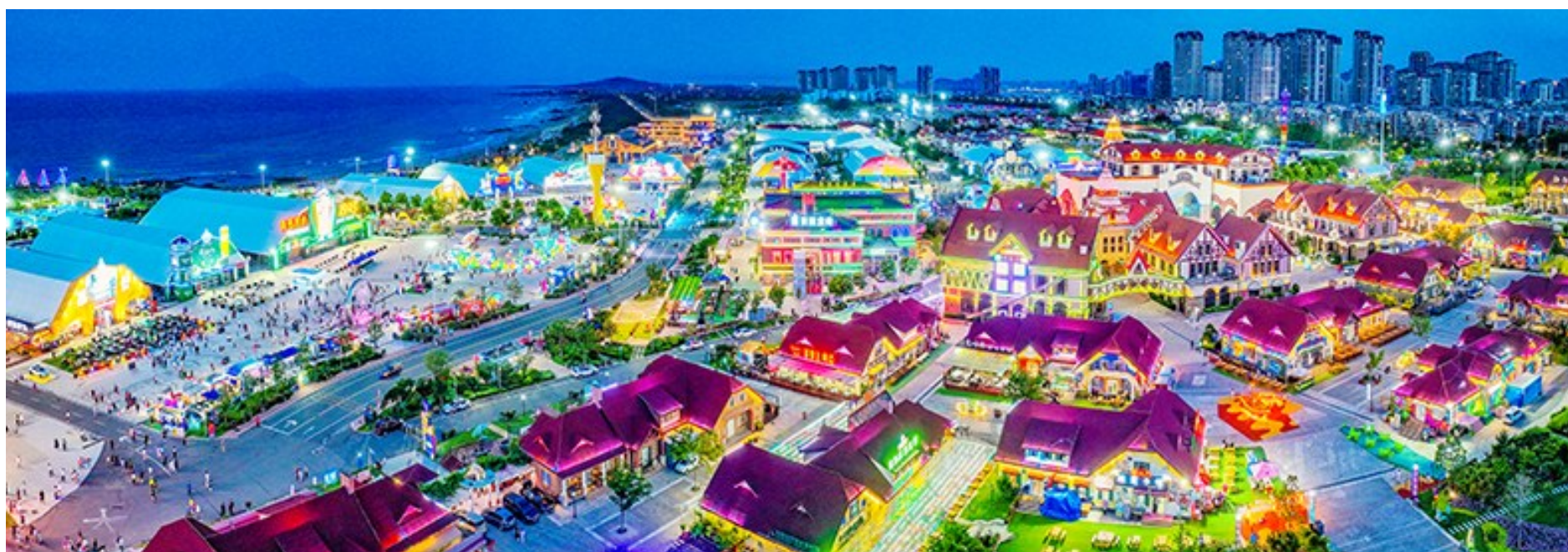
夜幕下的金沙湾啤酒城。

近年来,新区文旅产业发展势头强劲。全区文化产业示范(实验)园区(基地)5家,具有较强的文旅项目承载力,引进和培育亿元以上重点文化项目40余个,总投资额超过700亿元。其中,省级重点项目14个,文旅产业增加值占GDP比重超11%。全区不可移动文物204处,其中世界文化遗产1处,全国重点文物保护单位2处,国家级非遗3项,省级非遗7项,琅琊台遗址、明清海防遗址入选“山东五大考古新发现”。随着第五届国际公共艺术奖、第六届全国艺术产业园发展论坛、青岛凤凰音乐节、中国歌剧节、全国第五届正体书法大展等系列活动的举办,新区展现出了时尚城市的新形象,彰显了艺术城市新实力,有力提升了新区吸引力和影响力。