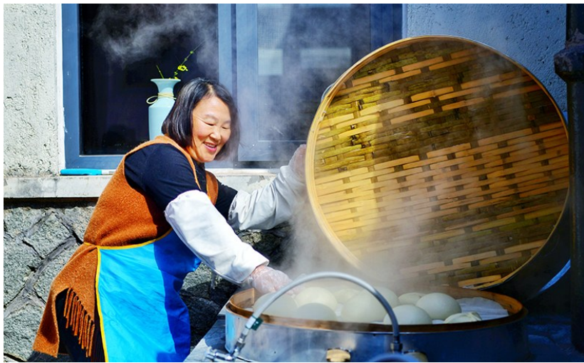
生意火爆的农家宴。

按照“田园景区化、景村一体化、文旅全域化”的理念,杨家山里正在进行一场“记得住乡愁”的现代化探索,传统与现代有机融入,让这片老区焕发出新的生机。