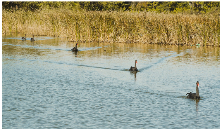
环境优美的唐岛湾。