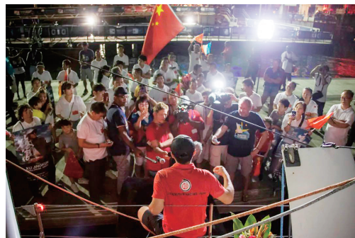
300名华人华侨在终点迎接中国船长。