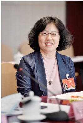
全国人大代表印萍。

“随着生态文明建设的深入，人民群众对美好生态环境的需求更加迫切，也更加具体细微。群众需要绿水青山，需要美丽的海岸线，需要水清草绿的湿地。而随着沿海地区社会经济高速发展，海洋和海岸带面临日趋严峻的生态空间紧缩、生态环境退化、海洋灾害风险上升