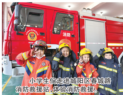
小学生们走进城阳区春城路消防救援站，体验消防救援。

本报2月24日讯 2月19日，城阳区春城路消防救援站迎来60多名“小小消防员”，白云山小学师生来到春城路消防救援站参观学习。第一次看见灭火救援器材和各种各样的消防车，小学生们都觉得新奇，不断发出提问，消防救援人员一一进行