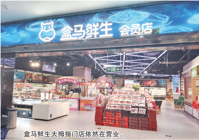
盒马鲜生大拇指门店依然在营业。

事实上，这也并非盒马鲜生在青岛首次闭店，就在一年前的2月28日，盒马鲜生关闭了其泰山路门店，该门店的营业时间甚至不超过2年。