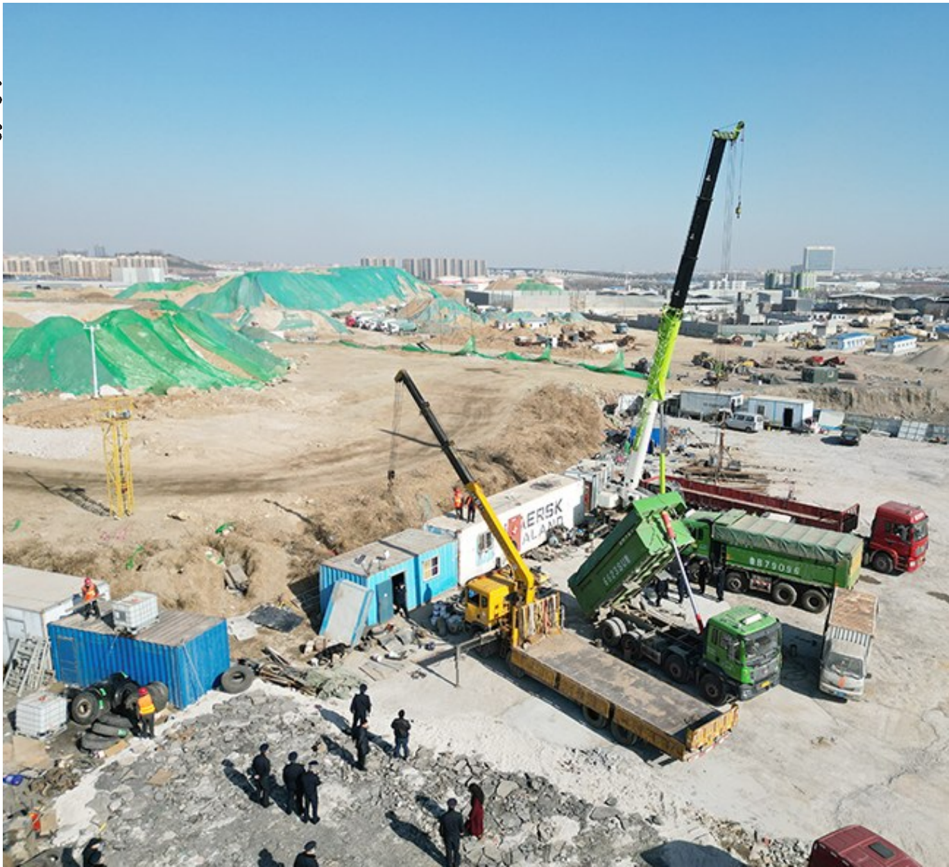
吊车到场协助吊走集装箱。

近年来，不少市民向晚报吐槽，开车经过环湾路滨海路路口附近，有时能看见灰尘漂浮，看见满身污泥的大货车，站在高处望去，还能看见成片的土堆和低矮板房——这些和文明城市不相容的景象，今年开始将被整治。2月21日，记者跟随李沧区综合行政执法局执法人员的脚步，探访了整治现场。