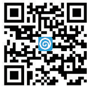
扫码看各物业企业信用等级情况