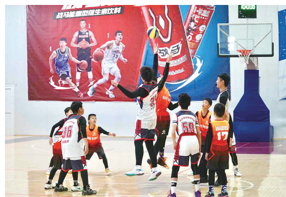
篮球少年场上比拼球技。

本报2月19日讯 18日上午,在青岛青之星篮球公园,随着篮球被高高抛起,2022-2023赛季中国人寿-NYBO青少年篮球公开赛青岛城阳赛区的比赛正式拉开序幕。