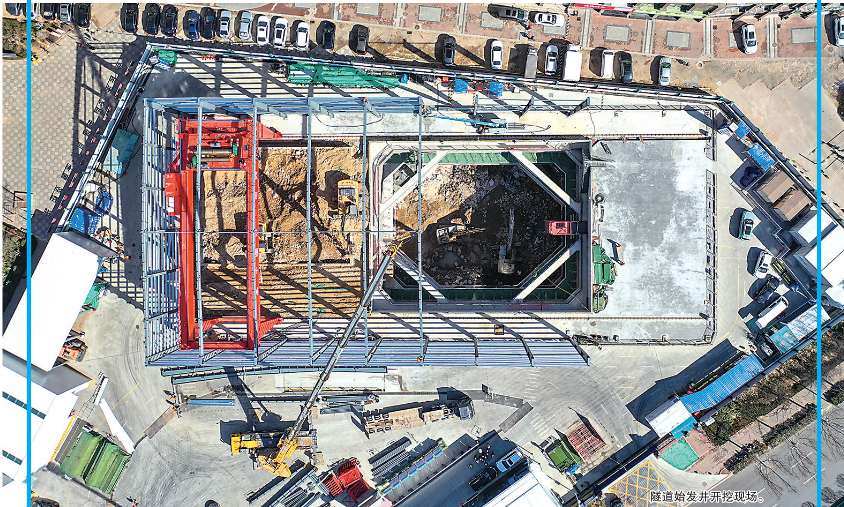
隧道始发井开挖现场。

开局即决战,起步即冲刺。15日上午,位于黑龙江路和金水路附近的地铁15号线下富区间(下王埠站-富锦路站),一片热火朝天的施工景象。轨道上的青岛,在加码提速。春节期间工人坚守岗位,节后迅速复工。与此同时,系列好消息不断传来,岛城地铁建设迎来“开门红”。