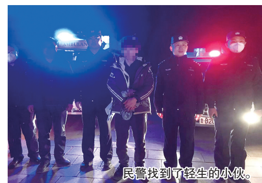
民警找到了轻生的小伙。

本报2月13日讯 2月9日凌晨3时许，青岛开发区公安分局灵珠山派出所接到一名小伙报警，他在小珠山上吃药轻生，吃药后却心生悔意，请求民警帮助挽救自己的生命。