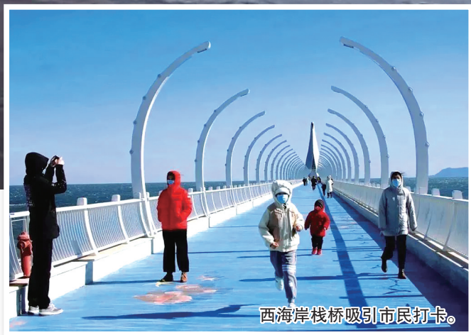
西海岸栈桥吸引市民打卡。

最近,位于青島西海岸新区古镇口核心区的中科院实验栈桥以其优雅、文艺的气质,成为新晋网红打卡地,大批游客慕名而来。中科院实验栈桥全长500米,共分为3层。在蓝天、白云的映衬下,碧波万顷中那一抹“栈桥蓝”,总让人深爱不已。延伸入海的实验栈桥在兼具观赏性和浪漫气质的同时,还能满足科研与实验的需要。