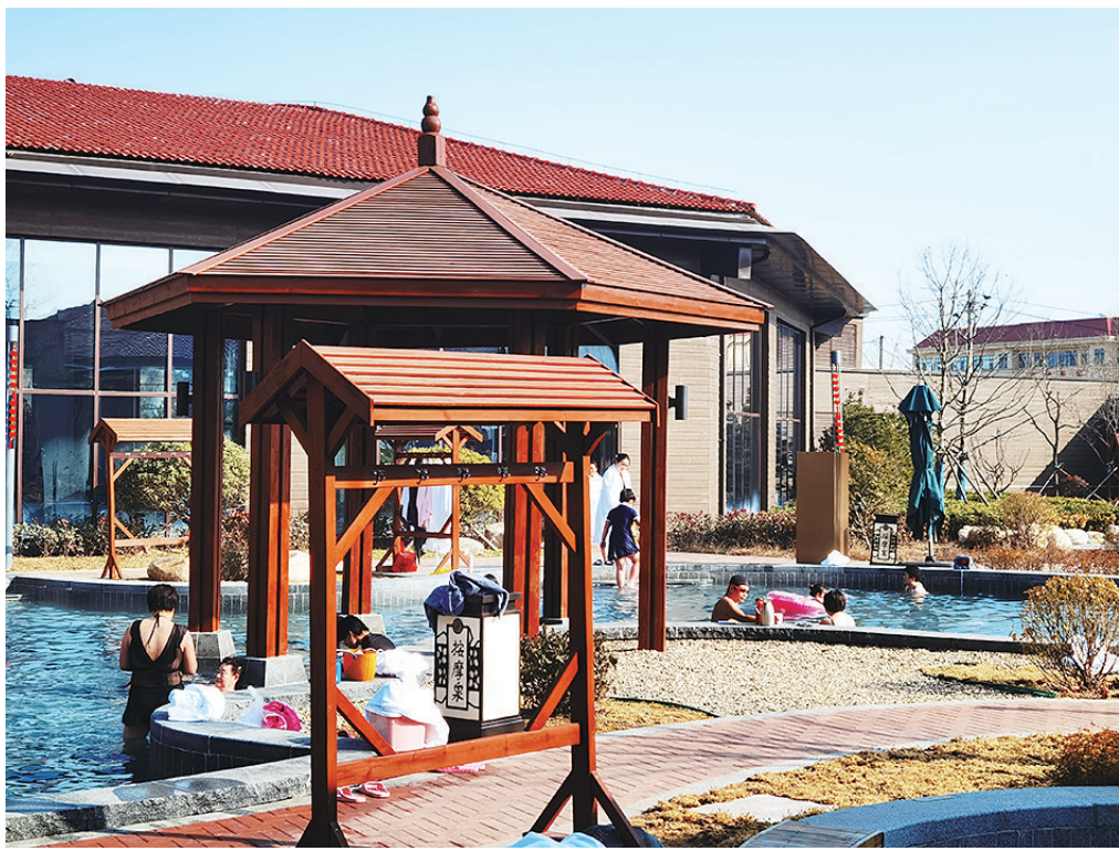
青岛工人温泉疗养院内的温泉泡池中不少游客在享受温泉浴。