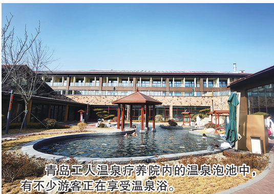
青岛工人温泉疗养院内的温泉泡池中,有不少游客正在享受温泉浴。