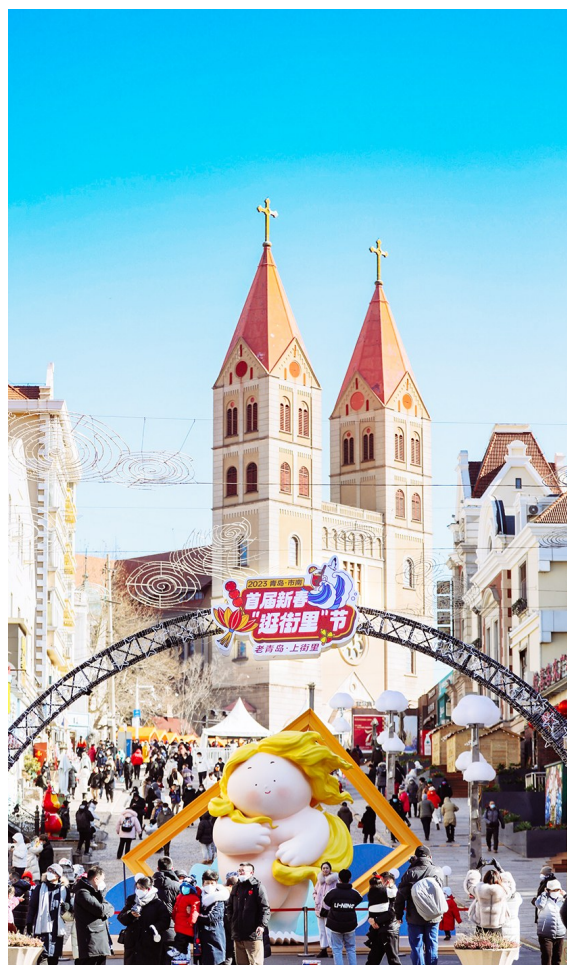
逛街里节的IP装置艺术展吸引游人打卡拍照。