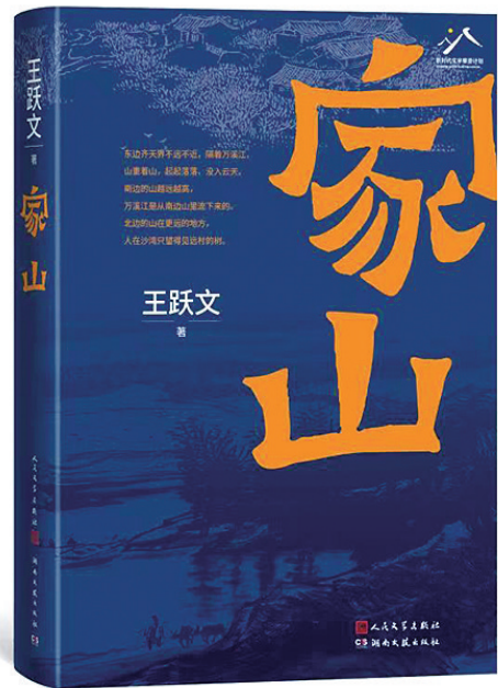
《家山》王跃文 著 人民文学出版社 2022年12月出版

时隔八年余,王跃文的新长篇《家山》面世了。在回归相对静默的八九年中间,王跃文搜集查阅了大量的历史文献、方志,钻研户籍田亩制度、捐税征收方式等等,多次重返乡间田野做实地考察,直到一方水土和那些村民已鲜明生动鼓涌于胸口,他才投笔于纸上,娓娓道出那些鲜活的故事。54万字的《家山》,描写南方乡村沙湾在上世纪上半叶的社会结构、风俗民情、耕织生活、时代变迁的长篇小说包含了王跃文的经历、思考和情感的人生积淀,凝聚了王跃文全部的生命体验和感悟。