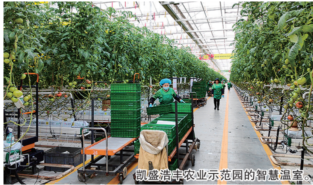
凯盛浩丰农业示范园的智慧温室。

据了解，莱西市上下铆足干劲，以乡村振兴示范片区建设为契机，重点打造6个乡村振兴示范片区，一体谋划和推进12个片区建设，坚持“农业+”“生态+”的发展理念，以“农业产业+生物技术+文旅产业+新型城镇化”融合发展为指引，集聚“第一书记”“乡村红色合伙人”“乡村设计师”等众人的智慧力量，探索打造可复制、可推广的乡村振兴“莱西路径”，高水平塑造农业农村现代化的发展先行样板。