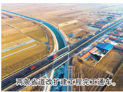
两条省道改扩建工程完工通车。