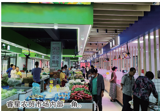
睿星农贸市场内部一角。

在浮山所农贸市场，刚刚完成升级改造的海产品区，蓝色的吊顶和蓝色的柜面相呼应，瞬间有了海底世界的氛围感。“升级改造之后，管理上应用‘智慧农贸’系统，顾客