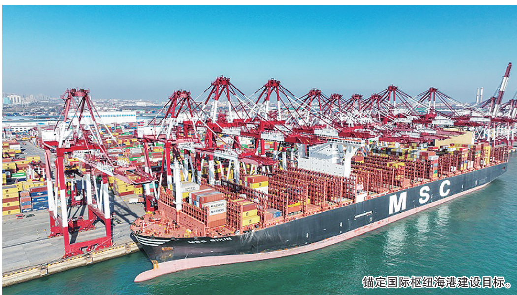
锚定国际枢纽海港建设目标。

在“四好农村路”高质量发展推进行动方面，到2025年，新建、改造农村公路1100公里以上，年均养护工程里程达到总量的7%以上。