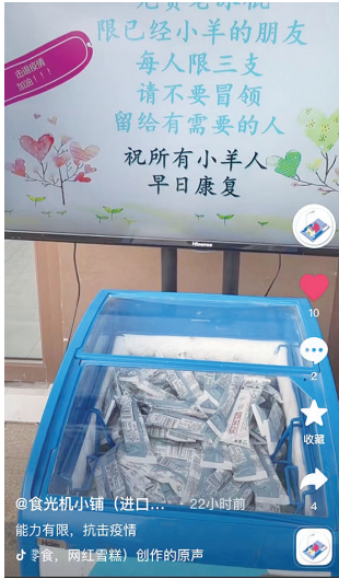
食光机小铺发短视频给有需要的邻居提供老冰棍。