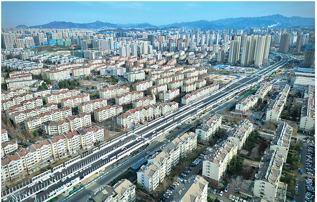
辽阳路快速路开通在即,如一条蜿蜒“长龙”。

交通基础设施建设方面,潍青高速(青岛段)年底建成通车,明村至董家口高速公路等5个项目提速建设。南北大动脉沈海高速改扩建工程年底开工建设。青兰高速公路(双埠至河套段)改扩建项目完成左半幅调流序,右半幅启动改建。国道204大沽河