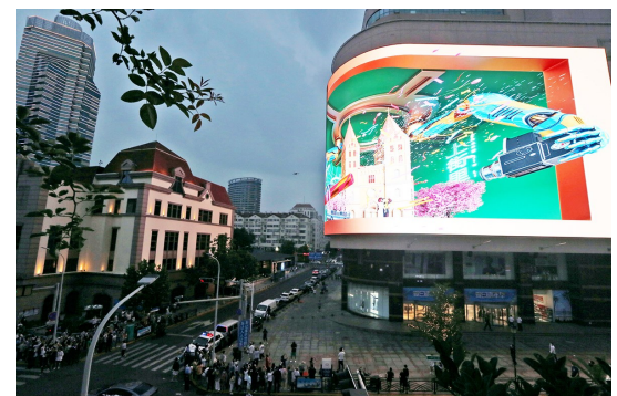
中山路巨幅裸眼3D大屏吸引了众多市民前来打卡。 拆除改造约270多万平方米。拆除违建349处,约310多万平方米。全市300个居民楼院达到环境秩序示范楼院创建标准,市南区云南路社区等30个社区基本达到“无违建”创建标准。