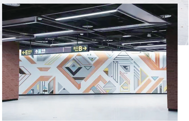
4号线西吴家村站内景。