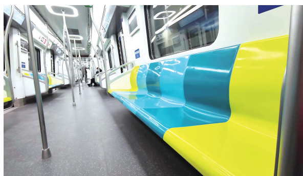
记者试乘地铁4号线带来初体验。