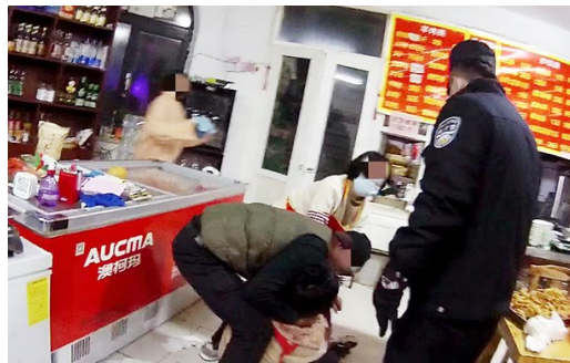
民警赶到现场施救。

本报12月15日讯 11日傍晚6时许,城阳公安分局指挥中心接到一名女孩报警,说“妈妈的脖子出血了”。民警进一步询问时,听见电话那头传来女子的哭喊声和打斗声。