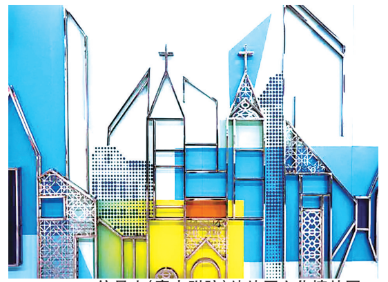
信号山(青大附院)站站厅文化墙特写。