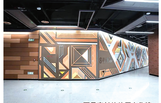
西吴家村站站厅文化墙。