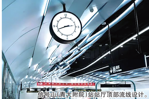
信号山(青大附院)站站厅顶部流线设计。

下一步,市运输中心将按照专家组意见建议,督促地铁集团、建设、运营等单位立即对评估发现的问题进行整改落实,明确整改时限、责任人以及整改措施,确保地铁4号线年底前顺利开通初期运营,进一步提升市民的出行效率和生活品质,为加速构建城