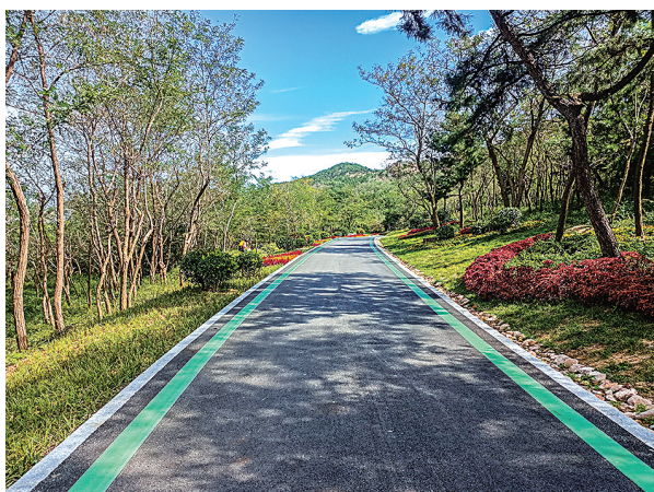
浮山防火通道（绿道）。