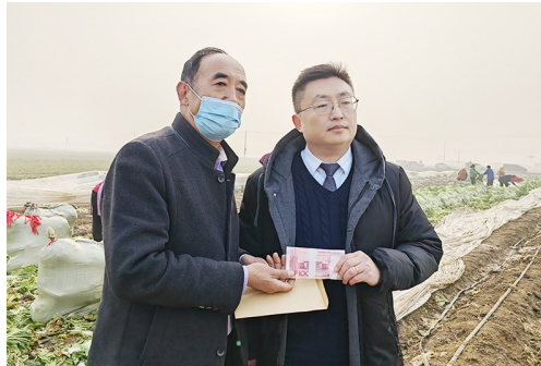
农户收到购买白菜的善款。