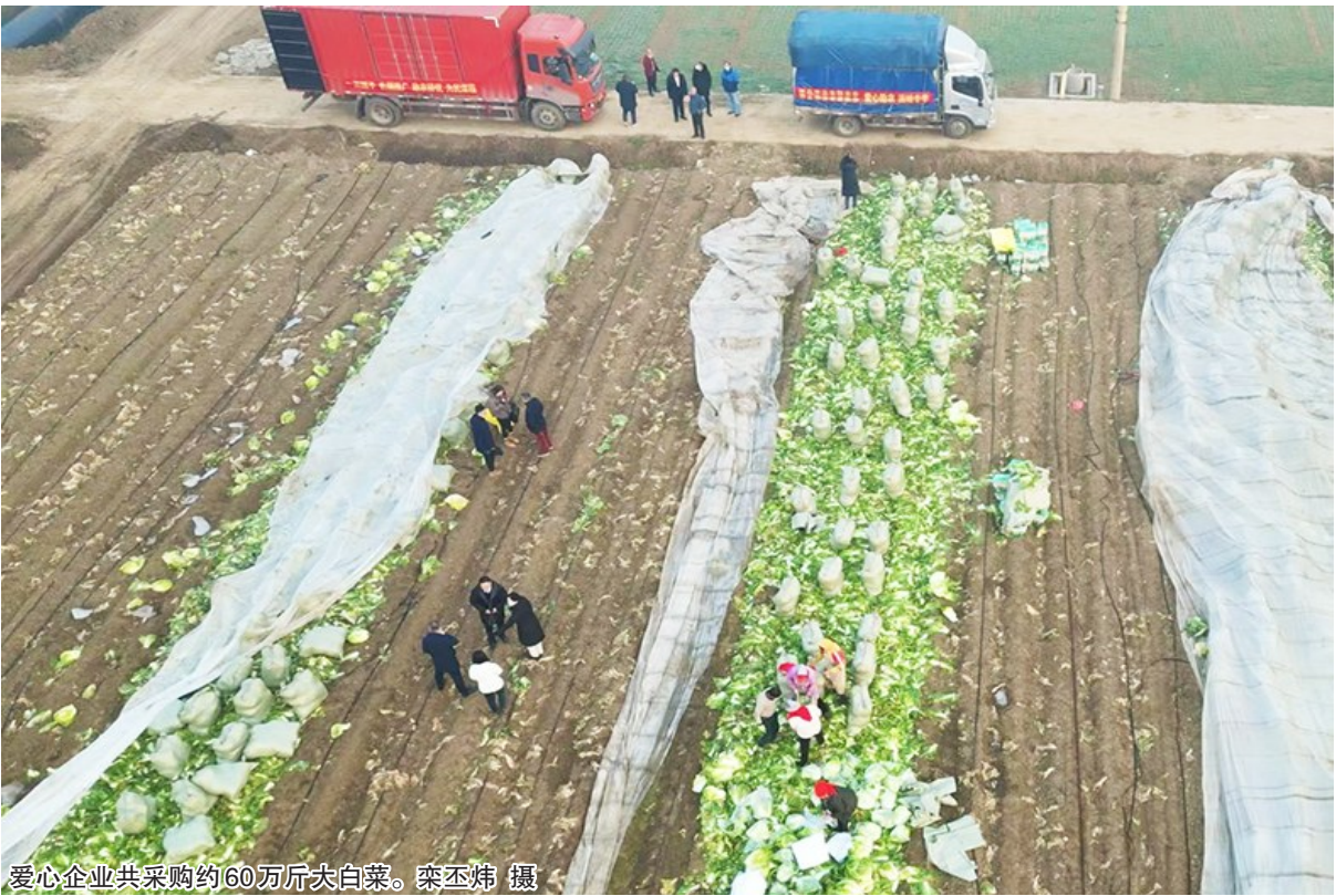
爱心企业共采购约60万斤大白菜。

“爱心助农 温暖冬季”公益活动仍在继续,有意愿购买爱心大白菜的企业可拨打晚报助农热线18661788285,我们期待您的加入! 观海新闻/青岛晚报 记者 李沛