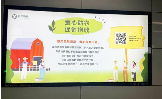
地铁集团多举措爱心助农。

本报12月9日讯 爱心助农,让爱传递。我市8部门近日发出助农倡议,青岛地铁集团工会联合青铁商业公司第一时间响应号召。连日来,青岛地铁集团各单位优先采购助销农产品供给职工食堂,各单位职工积极购买,奉献一片爱心。截至目前,青岛地铁集团工会、青铁商业工会及运营公司职工食堂已首批订购蔬菜近3万斤,各地铁参建单位、产业链、轨交集群企业也纷纷响应号召,加大助农产品采购比例。