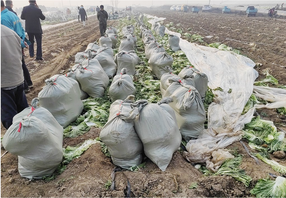
地头里白菜已经被打好。

照顾我们的农民伯伯满脸愁容,我们也和他們一样着急。昨天,农民伯伯和阿姨们带着红绳,拿着纸箱来到地里。他们终于为我们找到了好去处,这也是我的白菜生涯中意义的一天。 观海新闻/青岛晚报 记者 李沛