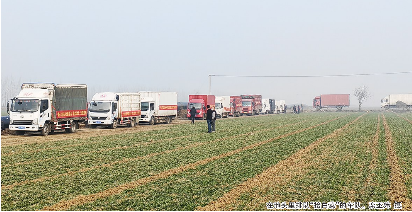
在地头里排队“接白菜”的车队。

“爱心菜”解民忧 助农公益行动参与电话 82860085 18661788285