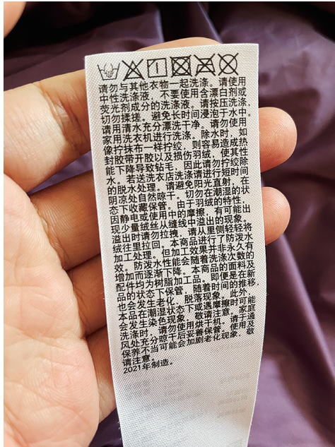
洗标。洗羽绒服前一定要仔细翻看羽绒服内侧的水洗标。

另外，儿童在使用安全座椅时应尽量避免穿羽绒服。某电视节目曾做过一次实验：把身高体重与1岁宝宝相似的2个假人模型固定在安全座椅上，一个穿羽绒服，一个不穿。车子撞击到墙壁后，穿着羽绒服的假人被滑出了座椅，头部向下悬空挂着；然而，脱掉羽绒服的假人则牢牢地固定在座椅中，只有轻微的回弹出现，并没有被滑脱出去。原来，当孩子穿