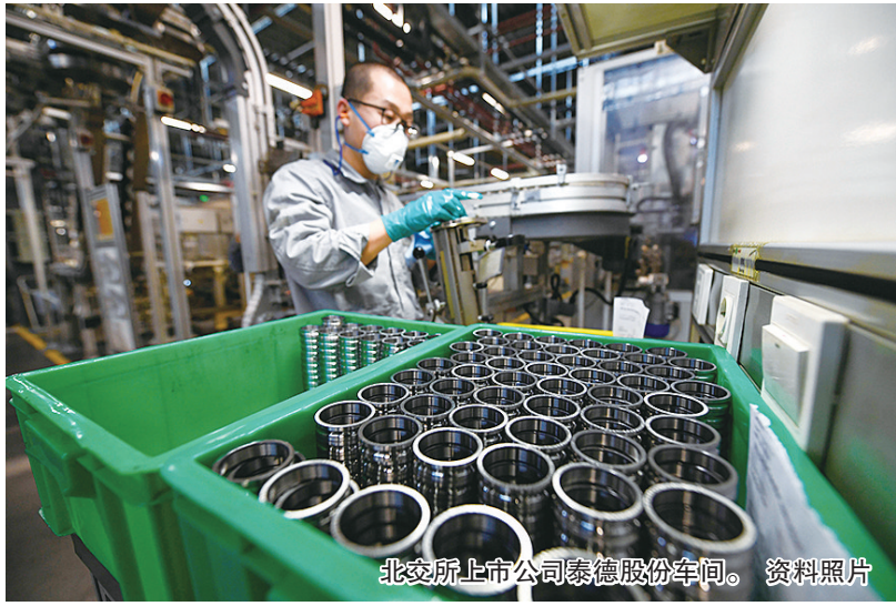
北交所上市公司泰德股份车间。资料照片

拉开青岛资本市场舞台的大幕,新生主角陆续闪亮登场。2021年11月15日,北京证券交易所(下称“北交所”)正式开市,如今已满一年。截至2022年11月11日,北交所共有上市公司123家,超八成集中在战略性新兴产业和先进制造业。