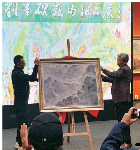
作品《崂山雄姿》捐赠给青岛市美术馆。