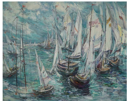
《海帆交响》 80x100cm 油彩麻布 2021年

其实青岛很难画好。刘青砚说外地画家来青岛写生,往往有很好的技术层面的表现,但是很难画出青岛的魂。“都说青岛漂亮,我说是一种美。青岛的美包含很多艺术因素。”刘青砚说也正是这些艺术因素,让青岛孕育出那么多文化艺术界名人。一个城市美的底蕴非常重要。大概也只有青岛生活的人,才能更懂得青岛美。