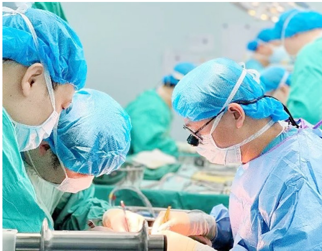
青大附院荣膺中国医院百强榜第53位。

2022年是党的二十大召开之年,是实施“十四五”规划、加快医院高质量发展的关键之年,青大附院坚持党建引领,坚持以人民为中心,统筹构建学科发展新体系,聚力夯实医疗质量新任务,阔步迈出科技创