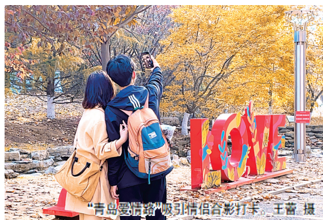
“青岛爱情路”吸引情侣合影打卡。

本报11月20日讯 日前,位于太平角公园的“青岛爱情路”浪漫涂鸭焕新,搭配乐队的现场演出,让爱意升级,甜蜜加倍,引得市民游客纷纷前往打卡游玩。