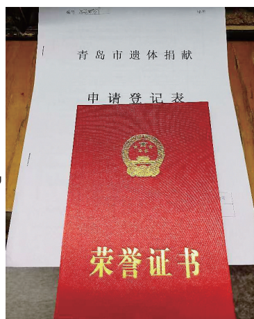
“胖爸爸”的捐献登记表和证书。