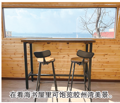
在看海书屋里可饱览胶州湾美景。