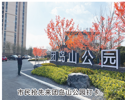
市民抢先来团岛山公园打卡。