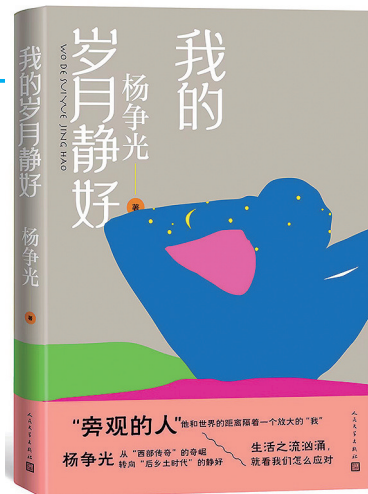
《我的岁月静好》杨争光 著 人民文学出版社 2022年8月 出版

书中精选了众多精美文物和古代风情画卷,用文字和直观图像还原古人真实的生活日常,带领读者沉浸式体验古人的市井生活,在诗意的趣味中感受东方生活美学和文化底蕴,在烟火气的市井生活中感受古人生活的酸甜苦辣,囊括的古代社会的风俗百态可以让读者一窥我们今天诸多思想文化、风土人情的根脉。