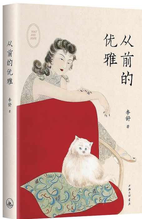
《从前的优雅》李舒 著 上海三联书店 2022年9月 出版

发誓要好好学习再也不打牌的胡适。”李舒认为,“无论是谁,放到历史的长河里,都只不过是大大时代里的一粒尘土。但我并不觉得虚无,因为活着本来就不是为了证明什么。只要我们在力所能及的范围内,让自己以优雅的姿态和面貌对待生活,如米小的苔花,也能在墙角处开出牡丹一般的花朵来。盛开过,便没有白活。”