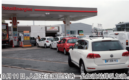
10 月 11 日,人们在法国巴约纳一处加油站排队加油。

欧洲深陷能源焦虑,美国供应商却赚得盆满钵满。比如,美国能源巨头埃克森美孚公司称,该公司今年二季度净收入为 179 亿美元,创下该公司有史以来最高单季