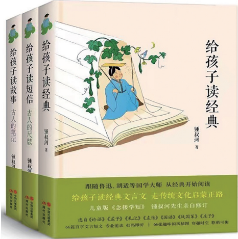
“给孩子读文言”钟叔河 著 现代出版社 2022年10月出版

古代诗书、文言经典，都是我国珍贵的文化宝藏。它们跨越了时空的限制，将古时文人墨客、诸子百家的奕奕文采、精气神韵和真理哲思带到了我们面前。但对于现代人而言，古文理解起来终究有一定的难度。 为了让孩子也能更好地感受到文言的简约之美，更能感受到中国传统文化之美，钟叔河专门为孙辈们作了这套“给孩子读文言”系列，引领孩子及根基尚浅的传统文化爱好者，走上传统文化启蒙正路。 钟叔河他坚持“谈古文，学作文，都应先学其短”，其作品《念楼学短》风靡近30年，成为了国人学习古文的经典之作。他选取《念楼学短》的精华198篇，改编成这套“给孩子读文言”系列，可以说是儿童版的《念楼学短》，不仅继承与延续了《念楼学短》的特色和精髓，还贴合6-12岁儿童群体，进一步增加了阅读的趣味性。 该系列包含《给孩子读经典》《给孩子读短信》《给孩子读故事》三本图书，每篇都包含“学其短”“念楼读”和“念楼曰”三部分。整套书皆为古文短篇，短则几字，长亦不超百字，故称“学其短”，作为入门读物完全没有负担。而这些选文内容丰富广泛，涉及了古代经典、名人逸事、寓言笑话、来往信件、奇闻怪事、名物探究，从各个方面展现了古人的生活、情感和思想。 每篇古文皆配附有详细的注释和译文——“念楼读”。译文行云流水，不追求字字对应的直译，适合我们当下的习惯与规范。钟叔河还为每