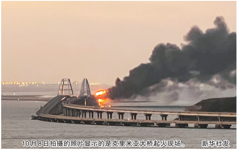
10月8日拍摄的照片显示的是克里米亚大桥起火现场。

据塔斯社8日援引克里米亚铁路部门的消息报道,当地时间早上6时(北京时间11时)左右,一列货运列车尾部的油罐车厢在驶过克里米亚大桥铁路桥时起火燃烧。 据俄罗斯国家反恐委员会通报,克里米亚大桥公路桥上一辆卡车发生爆炸,导致与公路桥并行的铁路桥上一货运列车上七个油罐被点燃;公路桥部分路段受损坍塌。 据塔斯社8日援引俄罗斯联邦调查委员会消息,克里米亚大桥爆炸目前已导致3人死亡。 克里米亚铁路部门的消息称,相关部门正在进行抢险作业。事故原因还在调查中。据了解,克里米亚大桥公路桥和铁路桥的交通受到限制,但大桥所跨刻赤海峡的航运没有受到影响。 俄罗斯总统新闻秘书佩斯科夫表示,普京总统已收到相关部门关于克里米亚大桥事件的报告并指示成立一个政府委员会,以应对大桥出现的紧急情况。 乌克兰国际文传电讯社8日援引乌执法机构的一位消息人士的话报道,克里米亚大桥爆炸是乌克兰安全局采取的一项特别行动。乌克兰安全局尚未就此发表评论。 俄罗斯外交部发言人扎哈罗娃在社交媒体账号上发文回应说,乌当局对民用基础设施损坏的反应“证明了其恐怖主义本质”。 当地时间8日,俄罗斯联邦侦查委员会表示,已确定在克里米亚大桥上发生爆炸的卡车车主的身份为克拉斯诺亚尔斯克边疆区居民,目前正在其居住地进行调查,此外还在调查卡车的行进路线以及证件等。 克里米亚大桥横跨刻赤海峡,连接克里米亚半岛和俄罗斯克拉斯诺达尔边疆区,全长19公里,跨海部分7.5公里,它是一座铁路、公路两用桥。 据新华社、央视、澎湃新闻