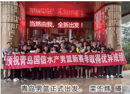
青岛男篮正式出发。

10月6日下午，青岛男篮迎来首场比赛。在2022-2023赛季CBA联赛季前赛首日比赛中，青岛国信水产男篮与北京控股相遇。最终，青岛男篮68:78不敌对手。作为以锻炼队伍为主的比赛，青岛男篮外援以及年轻球员的发挥让人眼前一亮。尤其是大外援里斯，替换上场后，一度帮助青岛队打出一波10:0，他的暴扣以及脑后传球更是点燃全场。全场比赛，里斯砍下22分外加10篮板，另一名外援尤金拿到12分。之后，在10月8日，青岛男篮将与深圳