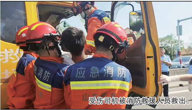
受伤司机被消防救援人员救出。

本报9月25日讯 21日下午,青岛西海岸新区藏马镇G204国道一处路口发生一起追尾事故,一名救援车司机被困在车内。 泊里消防救援站消防救援人员赶到现场后发现,一辆拉载着客车的救援拖车追尾一辆半挂货车后,拖车头损毁较为严重,前挡风玻璃全部碎裂,拖车驾驶舱的方向盘及中控台向内倾倒变形,压在拖车司机腿上,将货车司机困在驾驶座上动弹不得,好在拖车司机意识清醒,受伤不严重。消防救援人员在确认好安全支撑点后,利用液压顶杆将货车变形的操控台撑起,同时被困司机配合消防救援人员自行将腿从操作台下抽出,随后,消防救援人员小心翼翼将拖车司机从车内抬出至担架上,并移交现场的120急救人员。 (观海新闻/青岛晚报 记者 刘卓毅 通讯员 李清浩 高偲喆)