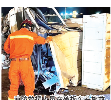
消防救援人员在破拆车头施救。

时许,青岛高新区火炬路岙东路路口,一辆厢式货车侧翻后困住司机。汇智桥路消防站消防救援人员到场后发现,厢式货车侧翻后,车头严重变形,导致驾驶员腿部被卡住。消防救援人员利用液压剪扩两用钳破拆车门,随后不断扩开方向盘下方空间,同时与被困司机不断说话,让他保持清醒配合救援。