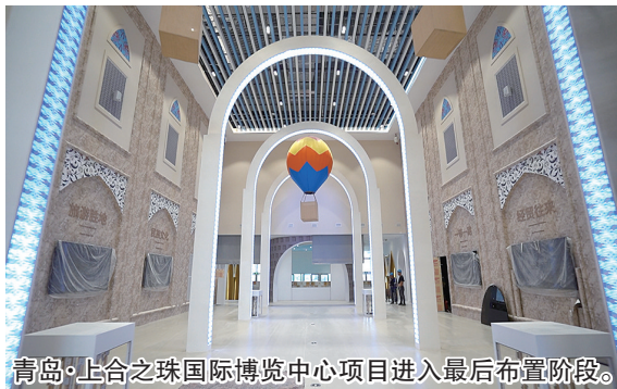
青岛·上合之珠国际博览中心项目进入最后布置阶段。