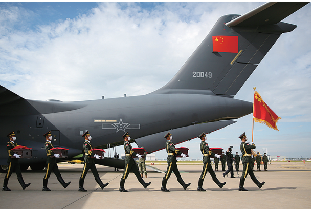
9月16日,在韩国仁川国际机场,中国人民解放军礼兵护送烈士棺槨登上解放军空军专机。