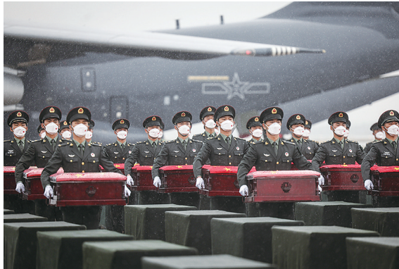
9月16日,在沈阳桃仙国际机场,礼兵将殓放志愿军烈士遗骸的棺槨从专机上护送至棺槨摆放区。