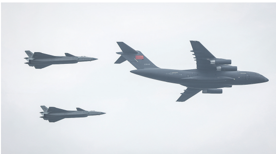
空军运-20专机于9时30分从韩国仁川机场起飞,进入中国领空后,两架歼-20为其护航,向英雄致敬。